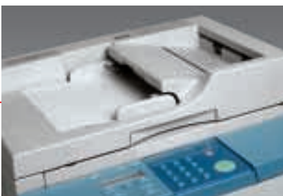
Produktiv: der Originaleinzug

Der Schlüssel zu mehr Effizienz: Über den Originaleinzug (ADF) werden mehrseitige Dokumente selbsttätig gescannt und kopiert. Mitarbeiter können so ihre kostbare Arbeitszeit für wichtigere Dinge nutzen.