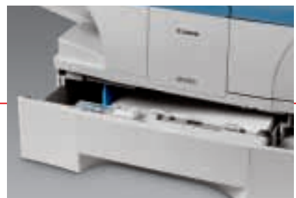
Ergiebig: die 500-Blatt-Kassette für große Dokumentenmengen