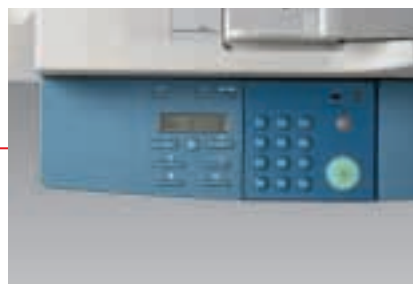
Übersichtlich: das Bedienfeld für einfache Handhabung